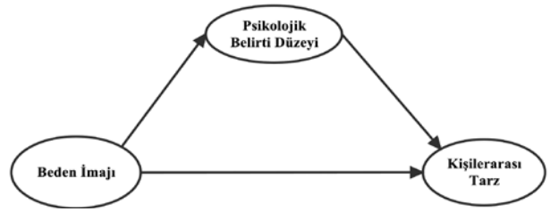
Şekil 1: Model 1: Beden imajı ile kişilerarası tarz arasındaki ilişkide psikolojik belirti düzeylerinin aracı rolü

Araştırma ilişkisel tarama modelinde gerçekleştirilmiş ve üniversite öğrencilerinin beden imajlarının, psikolojik belirti düzeylerini ve kişilerarası iletişim tarzlarını yordamasının değerlendirildiği yapısal modellerin test edilmesi amaçlanmıştır. Araştırma kapsamında test edilmesi planlanan hipotetik modeller Şekil 1 ve Şekil 2'de verilmiştir.