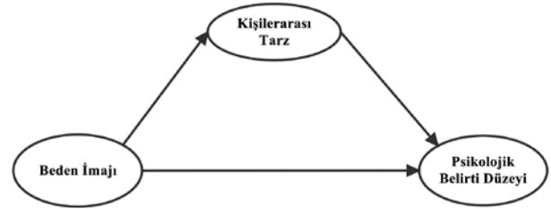
Şekil 2: Model 2: Beden imajı ile psikolojik belirti düzeyleri arasındaki ilişkide kişilerarası tarzın aracı rolü